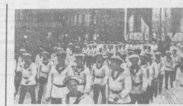
21 МАРТА — 50 ЛЕТ СО ДНЯ ПРОВЕЗГЛАШЕНИЯ ВЕНГЕРСКОЙ СОВЕТСКОЙ РЕСПУБЛИКИ. Первомайский парад 1919 года в Будапеште на улице, носившей ныне имя Аттилы Юнофе.

МОЙ американский друг прислал мне недавно отчет о любопытном обследовании, проведенном статистическим бюро одной из страховых компаний США. В основном — это неприкрашенные цифровые данные. Пусть достаются лавровый венчик тому, кто, исходя из них, напишет античную драму. Я лично ограничусь краткими рефератами, в которых не будет ни рифмы, ни заключительных рефератов. Из рассматриваемого мной отчета вытекает, что ежегодная стоимость учебы, вместе с платой за квартиру и еду, составляла не меньше 2,488 долларов. Кроме того, студенту приходится покупать книги и учебные пособия. Правда, к славному полу частные университеты проявляют несколько более чуткое отношение. Плата, взимаемая со студентов за учебу, квартиру и еду, равна 2,350 долларам — на 138 долларов ниже, чем у мужчин. Мовет быть, это объясняется тем, что женщины меньше едят или умеют лучше торговаться, чем мужчины? В государственных университетах такого разделения не знают. По крайней мере в них женщины и мужчины равны и платят за обучение в течение года по 1,102 доллара. Не если студент родом из соседнего штата, то с ним обходятся не по-соседски. Его заставляют платить 1,539 долларов — на 437 долларов больше, чем студентов своего штата. Другими словами, плата за учебу в частных университетах США почти в два раза выше, чем в государственных вузах. Далекие древние цифры показывают, что образование в «государстве благоденствия» обходится учащемуся в копейку. Причем,