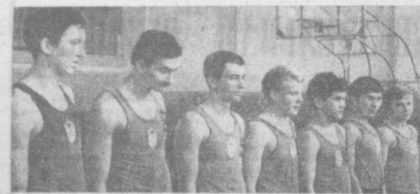
Успешно выступили в прошлом году юные баскетболисты ташкентского СКА. НА СНИМКЕ фотокорреспондента Н. Надеждина вы видите коллектив ташкентского СКА, ставшего чемпионом Советского Союза 1968 года среди юношей.

ков в Каунасе: «Буревестник» [Ташкент] — «Кунцево» — 21:27 (8:13); «Буревестник» [Ташкент] — ЗМИ [Запорожье] — 18:22 (6:13); «Буревестник» [Ташкент] — СКА [Львов] — 23:22 (17:11); «Буревестник» [Ташкент] — СКА [Киев] — 18:19 (13:9); «Буревестник» [Краснодар] — 22:28 (13:17); «Буревестник» [Ташкент] — «Кальгирис» [Каунас] — 20:21 (8:13).