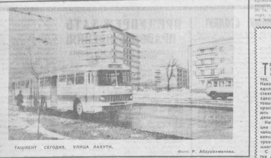
ТАШКЕНТ СЕГОДНЯ. УЛИЦА ЛАХУТИ.