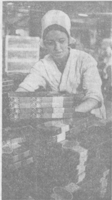
ЛЕНИНГРАД. За один день кондитерская фабрика имени К. Самойловой выпускает около двухсот тонн кондитерских изделий более 150 наименований. Большим спросом у покупателей пользуются конфеты «Птичье молоко».