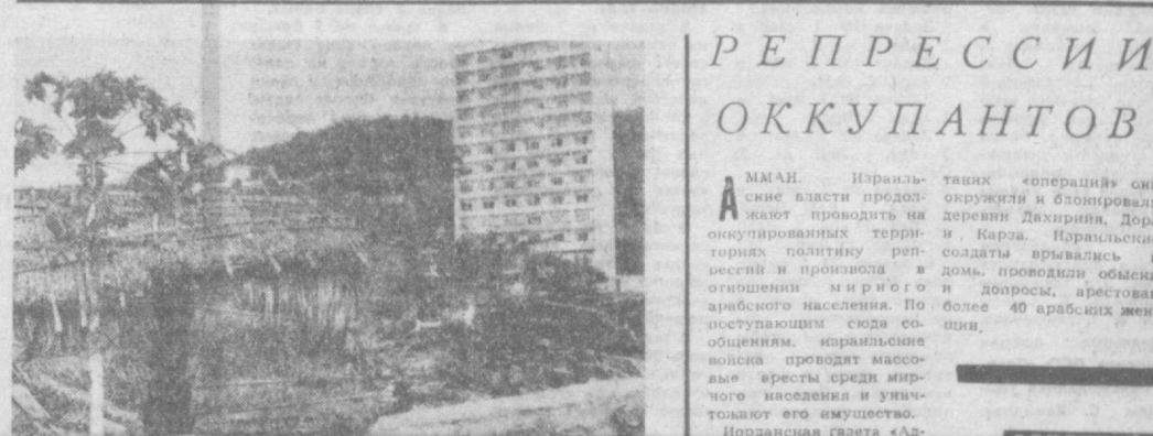
ЦЕНТРАЛЬНОАФРИКАНСКАЯ РЕСПУБЛИКА (ЦАР). НА СНИМКЕ: типичная африканская хижина и белоснежный отель «Сафари» в столице ЦАР — Банги. Такие контрасты молодой республики можно увидеть и в других городах страны.

АМАН. Израильские власти продолжают проводить на оккупированных территориях политику репрессии и произвола в отношении мирного арабского населения. По поступающим сюда сообщениям, израильские воины проводят массовые аресты среди мирного населения и уничтожают его имущество. Иорданская газета «Ал-Дустур» пишет, что израильские войска в последние время продолжают вольнолично в районе оккупированного Хермона. Во время одной из статистики сходились на самого низкого уровня платы. Во многих штатах есть частные университеты, плата за обучение в которых в течение года равна на заработку хорошего специалиста за 12 месяцев. Словом, прав был один американский доморощенный философ, заявивший: «Жевательная резинка стоит у нас гроши, зато образование обходится в тысячи. Поэтому многие останавливают свой выбор на первой». А что делает талантливый и жаждущий образования молодежь, которая не имеет возможности платить за каждый год учебы по 2,488 долларов? В упомянутом отчете на этот счет дается краткий и деловой ответ: она остается за воротами университетов. М. ЛАРНИ, финский писатель.