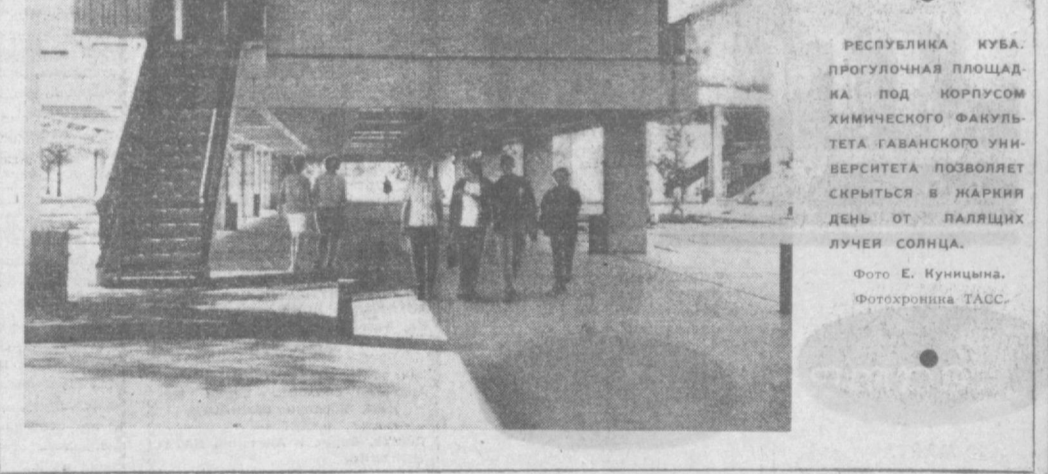
РЕСПУБЛИКА КУБА. ПРОГУЛочная ПЛОЩАДКА ПОД КОРПУСОМ ХИМИЧЕСКОГО ФАКУЛЬТЕТА ГАВАНСКОГО УНИВЕРСИТЕТА ПОЗВОЛЯЕТ СКРЫТЬСЯ В ЖАРКИИ ДЕНЬ ОТ ПАЛЯЩИХ ЛУЧЕЙ СОЛНЦА.

Наш народ до конца верный нерушимой дружбе с народами великой Советской страны, глубоко преданный марксизму-ленинизму и пролетарскому интернационализму, гневно осуждает новые позорные действия потерпевших голову пекинских авантюристов.