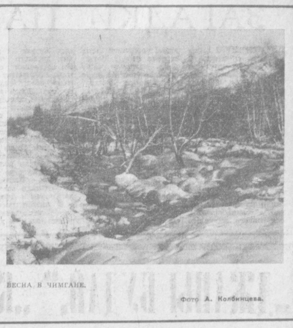
ВЕСНА В ЧИМГАНЕ.