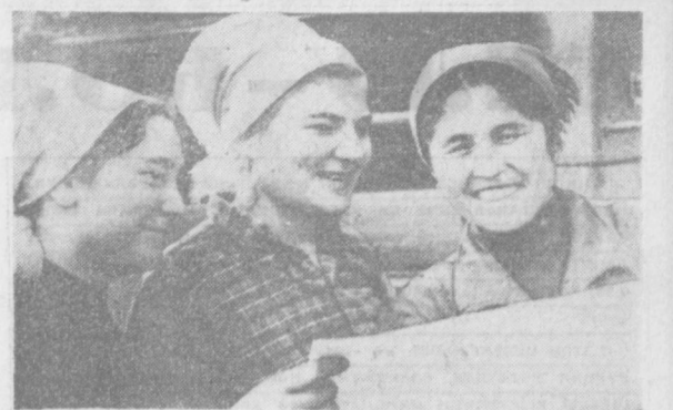
Все шире развертывается среди коллентива офсетной фабрики социализация за досрочное выполнение задания четвертого года пятилетки.

Автоматические межпланетные станции «Венера-5» и «Венера-6» продолжат совместный полет к планете Венера. Прилет станции «Венера-5» на планету ожидается 16 мая и станции «Венера-6» 17 мая 1969 года.