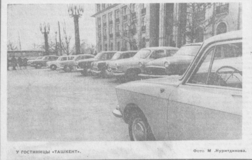
У гостиницы «ТАШКЕНТ».

Последующие места занимают сборные Канады, Финляндии и США.