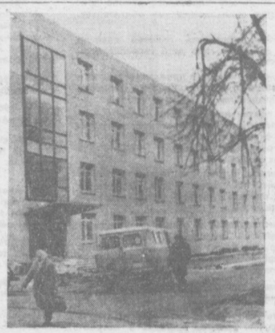
С каждым днем меняется облик Ленинского района столицы. За короткий период здесь построено много жилых домов, культурно-бытовых объектов, детских учреждений. Сейчас реконструируется здание Ташкентского вокзала, благоустроена Привокзальная площадь. Скоро здесь начнется посадка молодых саженцев и цветов. А по улице Пролетарской недавно сдано в эксплуатацию большое административное здание. На днях и по улице Чехова сдано в эксплуатацию еще одно административное здание треста «Водоканал».

НА СНИМКЕ: новое здание треста «Водоканал».