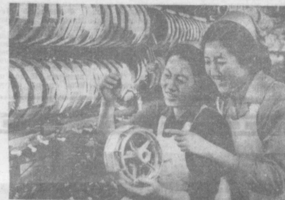
В послевоенное время в КНДР быстрое развитие получила текстильная промышленность. Некоторые виды продукции корейских текстильных экспортируются в Советский Союз. НА СНИМКЕ: в прядильном цехе пхеньянской шёлкоткацкой фабрики.