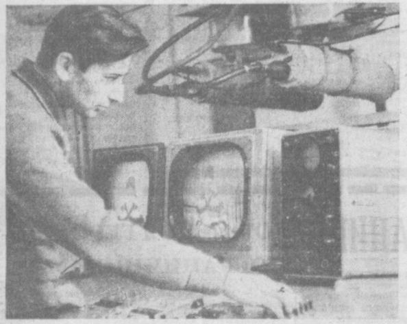
Видеотелефонная связь с двенадцатой горой страны обеспечит трудящихся Одессы всту-