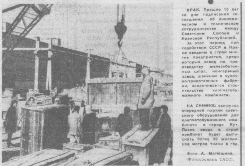
НА СНИМКЕ: выгрузка очередной партии советского оборудования для хлопчатобумажного комбината в городе Кут. После ввода в строй комбинат будет выпускать более 30 миллионов метров ткани в год.