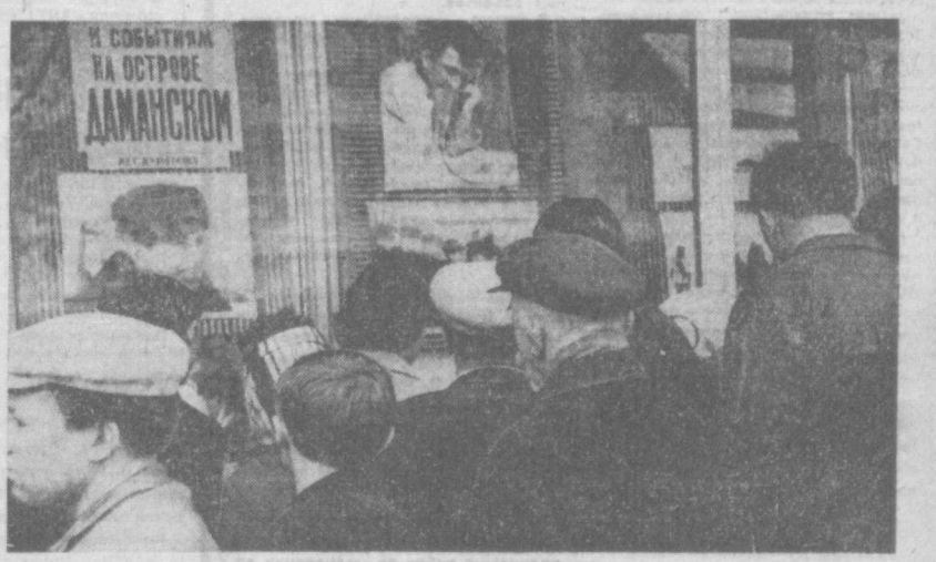
События на острове Даманском посвящен фоторепортаж, организованный корреспондентами газеты «Известия». НА СНИМКЕ: у фототрибуны, установленной на улице Карла Маркса в Ташкенте.

ИСПОЛКОМ ТАШКЕНТСКОГО ГОРОДСКОГО СОВЕТА ДЕПУТАТОВ ТРУДЯЩИХСЯ.