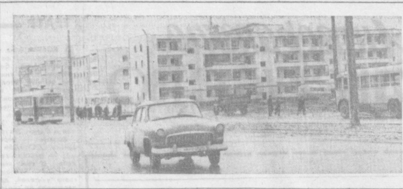
ТАШКЕНТ СЕГОДНЯ. УЛИЦА ЭНГЕЛЬСА.