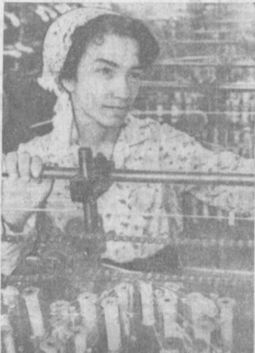
Разнообразную продукцию выпускает текстильно-галантерейная фабрика «Узкус» — одно из передовых предприятий города. К предвесеннему сезону фабрика выпускает много шелковых и газонных платков.