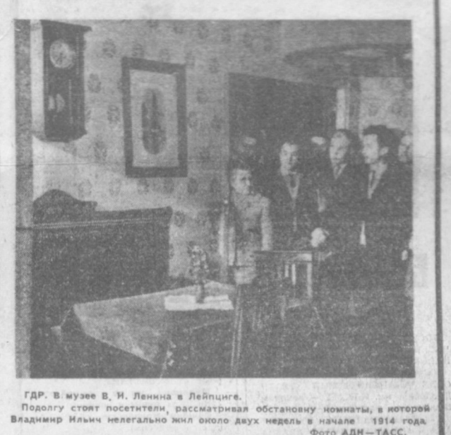
ГДР. В музее В. И. Ленина в Лейпциге. Подолгу стоит посетитель, рассматривая обстановку комнаты, в которой Владимир Ильич негласно жил около двух недель в начале 1914 года.

ЛОНДОН. Новые факты произвола израильских властей в отношении палестинской территории привели к своей статье корреспондент газеты «Сал-дид таймс», побывавший в городе Хеброн на западном берегу реки Иордан. С начала оккупации Хеброна, пишет корреспондент, израильские военные власти разоружили бульдозеры и взорвали в городе 60-