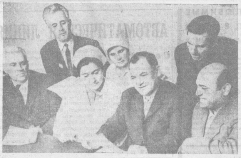
Большин производственных успехов добился коллектив фабрики «Урган» после перехода на новую систему планирования и экономического стимулирования.

Жизнь показала, сколь благотворно воздействует реформа на рост экономики заводов и фабрик. Задача состоит в том, чтобы успешно претворить в практику разработанные партией принципы хозяйствования, полнее использовать резервы, успешно обеспечить досрочное выполнение планов пятилетки и социалистических обязательств, принятых в честь 100-летия со дня рождения В. И. Ленина.