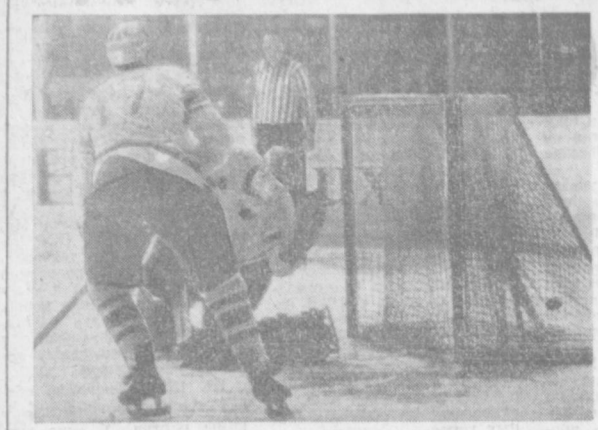
СТОКГОЛЬМ. ЧЕМПИОНАТ МИРА ПО ХОККЕЮ С ШАЙБОЙ. В МАТЧЕ СБОРНЫХ КОМАНД СССР И ШВЕЦИИ ПОБЕДИЛИ СОВЕТСКИЕ СПОРТСМЕНЫ СО СЧЕТОМ 4:2. НА СНИМКЕ: ТРЕТЬЯ ШАЙБА В ВОРОТАХ СБОРНОЙ ШВЕЦИИ.