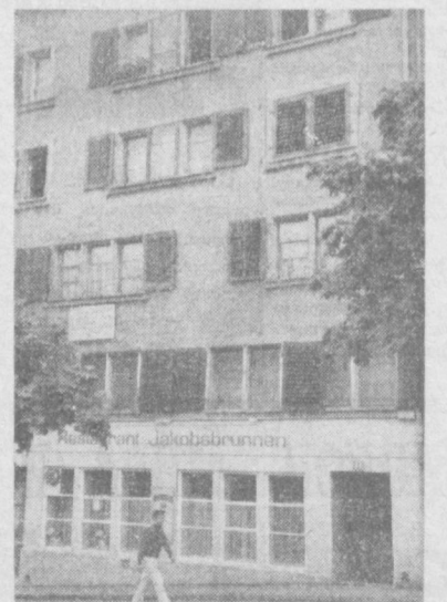
ШВЕЙЦАРИЯ, ЦУРИХ. Дом № 14 по улице Шлигелгассе. Здесь с 21 февраля 1916 года по 2 апреля 1917 года жили В. И. Ленин и Н. К. Крупская. Под одним из комнат на третьем этаже, где жил В. И. Ленин, установлена мемориальная доска.

низации похода протеста на Мадрид жительницы испанской деревушки Паломарес. В январе 1966 года там развился американский стратегический бомбардировщик с ядерным бомбом на борту. Медина Сидония находилась на свободе, пока ее адвокат не принял попытку донести переморозу несправедливого приговора. Однако верховный суд Испании отклонил по обвинению в орга-