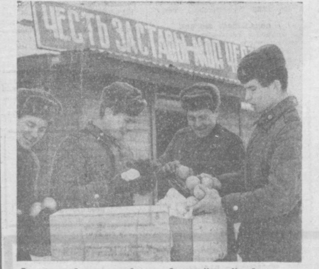
Тихоокеанский пограничный округ. Застава Нижне-Михайловка. Пограничники получили посылку. Ежедневно на заставу приходит доставка писем со всех концов страны. В них выражены любовь и восхищения героическими защитниками советской земли. Тихоокеанский пограничный округ.