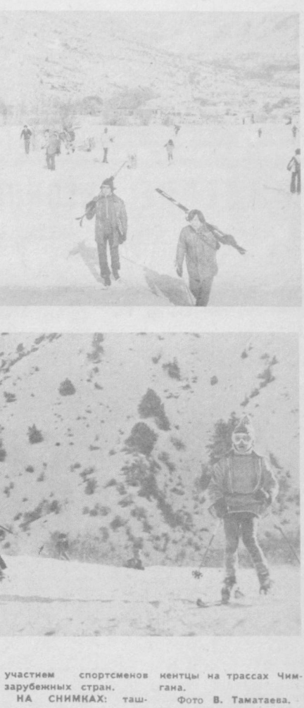
ПРОПРИЯТИ: V тур Кубка СССР и следом Кубок «Большой Чимган» с участием спортсменов зарубежных стран. НА СНИМКАХ: ташкентцы на трассах Чимгана. Фото В. Таматаева.

Совсем недавно Чимган привлек только самостоятельных туристов. Но постепенно тут стали вырисовываться контуры туристической зоны отдыха. Здесь были построены коттеджи. Потом выросли девятиэтажные корпуса новой гостиницы. Отдых в Чимгане стал более организованным. Свежий горный воздух, снег, таяние на лыжах и санях — все это привлекло многих ташкентцев. Они здесь в выходные дни получали прекраснейший заряд бодрости, энергии перед новой трудовой неделей. Сейчас Чимган не только место отдыха. Он стал местом проведения крупных всесоюзных и международных соревнований по горнолыжному спорту. И не случайно. Энтузиасты-горнолыжники доказали, что горы Узбекистана являются собой идеальное место для развития и популяризации этого вида спорта. К тому же снег на вершинах Чимгана лежит не только зимой, но и весной и осенью. А ученые определили, что чимганский снег по своему составу схож со снегами, покрывающими Альпы. Вот и в этом году на снежных склонах Чимгана вновь пройдут два крупных спортивных мероприятия: V тур Кубка СССР и следом Кубок «Большой Чимган» с участием спортсменов зарубежных стран.