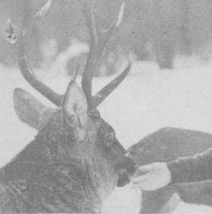
НА СНИМКЕ: в гостях у обитателей Лосиног острова — крупнейшей лесопарка Москвы.