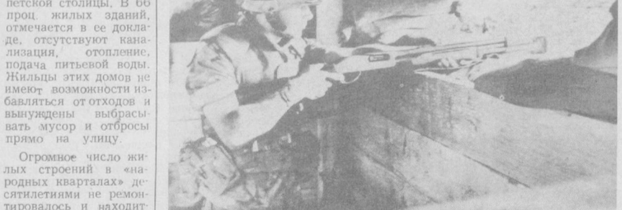
Американские морские пехотинцы продолжают хозяйничать в Ливане, нагнетая обстановку в этой многострадальной стране. В последнее время они значительно расширили масштабы военных операций на ливанской территории. НА СНИМКЕ: американский «мироворвец» в бункере перед зданием штаб-квартиры контингента морской пехоты США в Бейруте.

В работе IX слета принял участие секретарь ЦК ЛКСМ Узбекистана Х. Х. Хамидов.