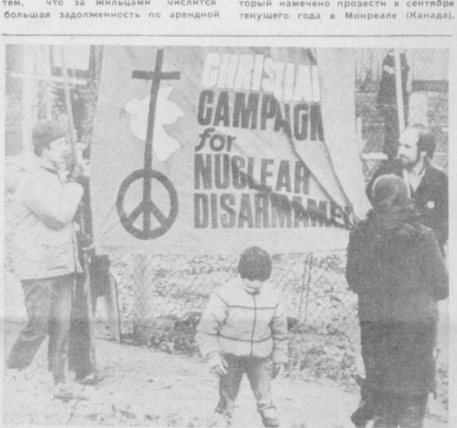
Около 300 человек приняли участие в демонстрации протеста против развертывания на Британских островах американских ирландских ракет, которая состоялась перед военно-воздушной базой США Дус-Хилл в окрестностях английской столицы.

Борьбу за полноценный сон надо начинать с таблеток, а с нормализации жизни, разумного сочетания умственного и физического труда.