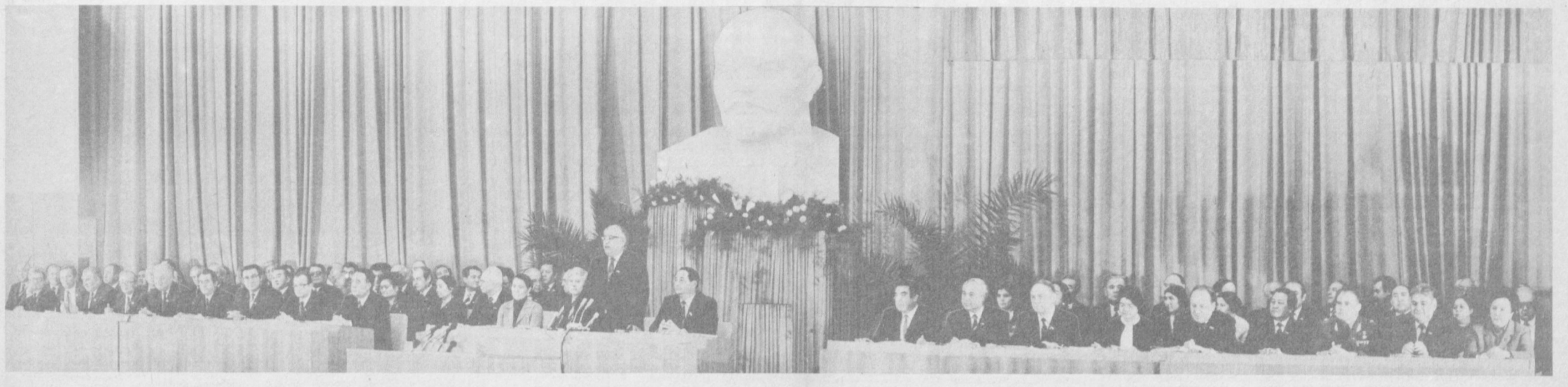
ТАШКЕНТ. На снимке: президиум заседания девятой сессии Верховного Совета Узбекской ССР десятого созыва.

Министр придется, в частности, вернуться к вопросу о перераспределении национальных взносов в бюджет сообщества, большая часть которого идет на финансирование единой аграрной политики.