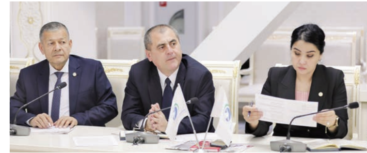
Muhokamadan so'ng qonun loyihasi deputatlar tomonidan qo'llab-quvvatlandi.

Shu bilan birga, davlat organlari tomonidan fuqarolik jamiyati institutlariga bevosita davlat ijtimoiy buyurtmalari berilishining yangi mexanizmlari va boshqa masalalar belgilanmoqda. Mazkur qonun loyihasining qabul qilinishi fuqarolik jamiyati institutlarini davlat tomonidan qo'llab-quvvatlash tizimida institutsional yaxlitlik ta'minlanishiga, shaffoflik va samaradorlik oshirishiga, ijtimoiy sheriklik munosabatlari rivojlanishiga, shuningdek, jamoat fondlari faoliyatida ortiqcha byurokratik talablar qisqartirishga xizmat qiladi. Yig'ilishda qonun loyihasi deputatlar tomonidan qo'llab-quvvatlandi.