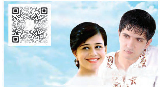
«Бегона баҳор» фильми.