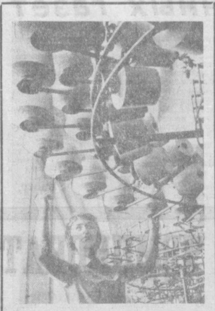
В Орске выдала продукцию первая очередь крупнейшей на Урале фабрики бельевых трикотаж, имеющей проектную мощность 18 миллионов изделий в год. На фабрике смонтировано современное отечественное и импортное оборудование, позволяющее производить трикотаж всевозможных узоров и расцветок из шерстяной, хлопчатобумажной и синтетической пряжи.

В. НАБАТЧИКОВ, старший научный редактор издательства «Знание», г. Москва.