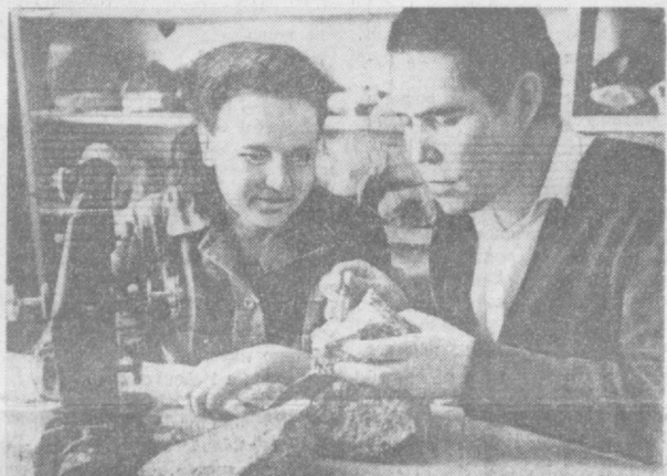
Большими трудовыми успехами встречают праздник геологов коллектив комплексной геологической поисковой экспедиции треста «Ташкентгеология». Крупным успехом коллектива КГПЗ является разведка и обнаружение в Ташкентской области запасов золота промышленного характера.