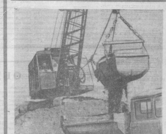
На карьерах рени Чирчик с утра и до позднего вечера идет погрузка песка и гравия для строительных работ, ведущихся в Ташкенте.

Массовые хашары в прошедшие субботу и воскресенье состоялись во всех районах города.