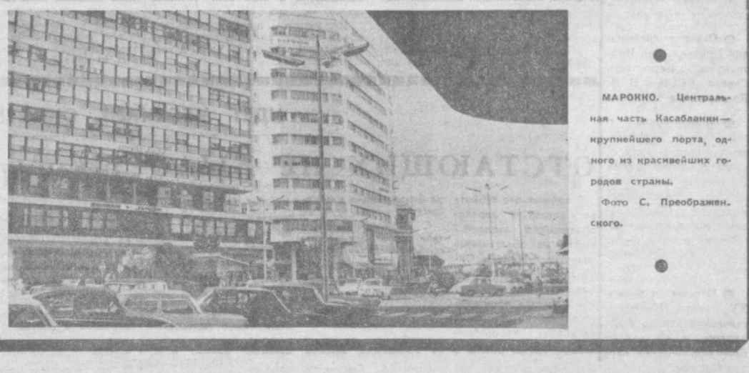
МАРОККО. Центральная часть Касабланки — крупнейшего порта одного из красивейших городов страны.

антидемократических кругов, которые стремятся провозгласить премьер-министром Моше Даян. Целью этой кампании является установление в Израиле военной диктатуры и уничтожение всех демократических свобод. Возвращение к власти Моше Даян, использование неправомерного положения и угрозы военным путем, назначить Моше Даян министром обороны. Принимая во внимание опасные тенденции в развитии политической жизни страны, политбюро Компартии Израиля опубликовало воззвание ко всем демократическим и мирнолюбивым силам с призывом вести совместную борьбу против правой угрозы. В воззвании, в частности, говорится: «В последнее время усилилась деятельность праворадикальных, милитаристских и