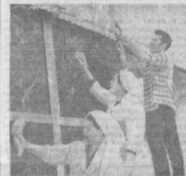
НА СНИМКАХ (сверху вниз): * Работники завода «Узбексельмаш» на субботнике. * Группа рабочих завода «Подъемник» благоустроивает улицу Пролетарскую. * На субботнике, в парке культуры и отдыха «Победа».