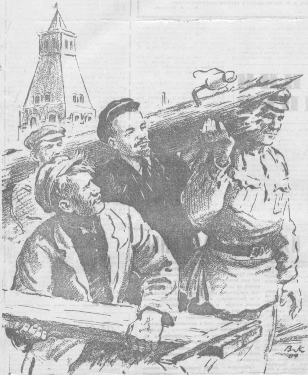
Рисунок народного художника УзССР В. КАНДАЛОВА.

ОРГАН ТАШКЕНТСКОГО ГОРКОМА КП УЗБЕКИСТАНА И ТАШГОРСОВЕТА