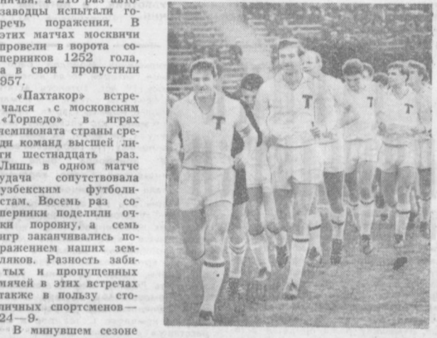
В нынешнем сезоне ворота москвичей не будет защищать их олимпийский голкипер Анзор Кавказавили, перешедший в столичный «Спартак».