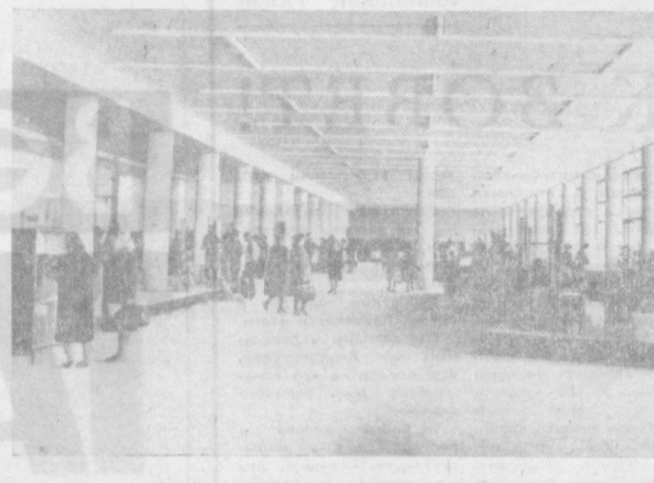
В КОНЦЕ марта в Ташкенте вступил в строй новый торговый центр — Дом мебели. Его построили в дар жителей столицы Узбекистана донецкие умельцы. Дом мебели располагает огромным залом. Горжаны смогут приобрести здесь не только мебель, но и многие предметы для украшения квартир — керамику, светильники, обивочные ткани и многое другое. НА СНИМКАХ: сверху — общий вид Дома мебели; слева — в торговом зале.