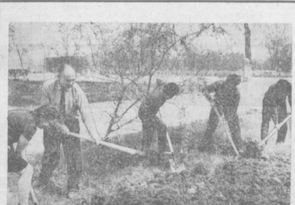
Сотрудники Республиканского государственного комитета трудовых ресурсов благоустраивают часть улицы Абдуллы Тукаева.

Узбекистана. Сносят старое помещение. На его месте поднимется новый производственный корпус. Нет возможности рассказать обо всем, что сделано молодежью в этот знаменательный день. Она была всех активней, всех веселее. Только школьников вышло на субботник более 5 тысяч.