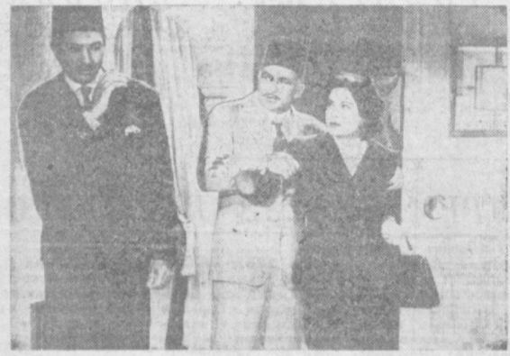
Софи Лорен, исполнители главных ролей в фильме «Братья Карамазовы».

Образы главных героев, панорама России — страны пытливых умов и сильных страстей, образ самого писателя, озабоченного и взволнованного проблемой совести человеческой, обличителя уродующей силы денег и социального неравенства предстают в движении трехсерийного фильма, в напряженности режиссерских и актерских поисков и получении благодарную оценку общественности и требовательного советского зрителя. Итальянский режиссер Витторио Де Сика хорошо известен широкому зрителю по фильмам «Похитители велосипедов» и «Брак по-итальянски». Сейчас на наших экранах выводит новую работу режиссера — «Затворники Альтоны», поставленная по известной пьесе Жан-Поля Сартра. Страстная антифашистская направленность этой пьесы увлекала не только режиссера, но и актеров, исполнителей главных ролей — Софи Лорен,