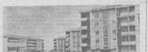
«Вечерний Ташкент» получил ответ „ЗА ЧИСТОТУ КАЖДОЙ УЛИЦЫ“