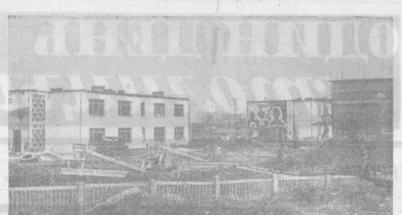
Ленинградские строители готовят в дар малышам Ташкента детский комбинат на 250 мест. Строят его Ленинградский ДСМ-2. Все торцовые стены трех зданий украшаются мозаичными панно на темы детских сказок.