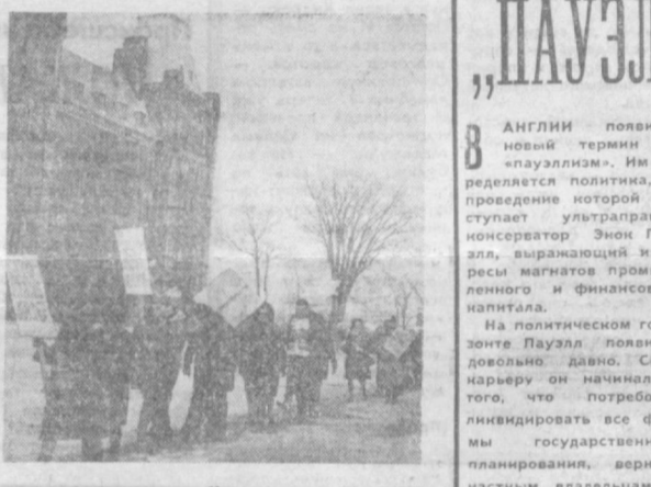
ОТТАВА. Компартия Канады проводит активную кампанию за выход страны из агрессивного блока НАТО.

БОНН. За признание Германской Демократической Республики высказались делегаты окружной конференции инженерной организации «Соколы», состоявшейся в Леверкузене. В другом решении они потребовали признания границы по Одере—Нейсе и объявления недействительным с самого начала Мюнхенского соглашения 1938 года. Делегаты конференции подчеркивали также настоятельную необходимость признания «реального положения, возникшего в Европе после второй мировой войны». Требование о международном правовом признании Германской Демократической Республики выдвинул также «Союз немецких инженерных студентов» на своем собрании в Мюнхене.