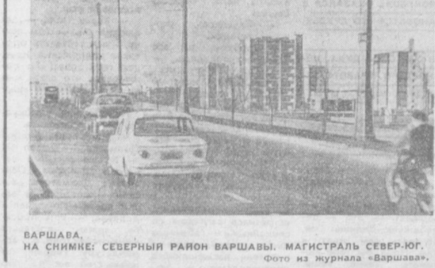
ВАРШАВА. НА СНИМКЕ: СЕВЕРНЫЙ РАЙОН ВАРШАВЫ. МАГИСТРАЛЬ СЕВЕР-ЮГ.