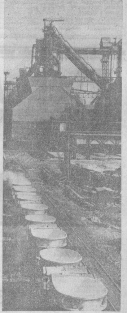
ВОЛОГОДСКАЯ ОБЛАСТЬ. На Череповецком металлургическом заводе выдана первый мунгун сверхкрупная доменная печь объемом 2700 кубических метров. Ее проектная производительность — 1 миллион 800 тысяч тонн чугуна в год. Такого количества чугуна не давал еще ни один доменный агрегат.

МАЛЬЧИШКА пришел в театр Иланов, и такое неоглядное впечатление произвела на него старая роспись, что решил обязательно научиться этому оригинальному искусству. Найдя в один из залов Дворца пионеров им. В. И. Ленина, и вы попадете в сезонный мир. Как только солнце осветит его стены, они точно «просыпаются» от сна. Вот «намеренный» цветочный и геометрический орнамент, учатся притягивать рисовальщиков, чтобы их обрабатывать гилс. Юные ребята участвуют в выставке «Мой Узбекистан», где вспоминают лучшие работы студийцев Средней Азии. Но, пожалуй, больше всего волнений ребят и их руководителей доставляет подготовка к 100-летию со дня рождения В. И. Ленина. С большой любовью и старанием они выполняют работы, посвященные славному юбилею. Ф. МАРГОВСКИЙ.