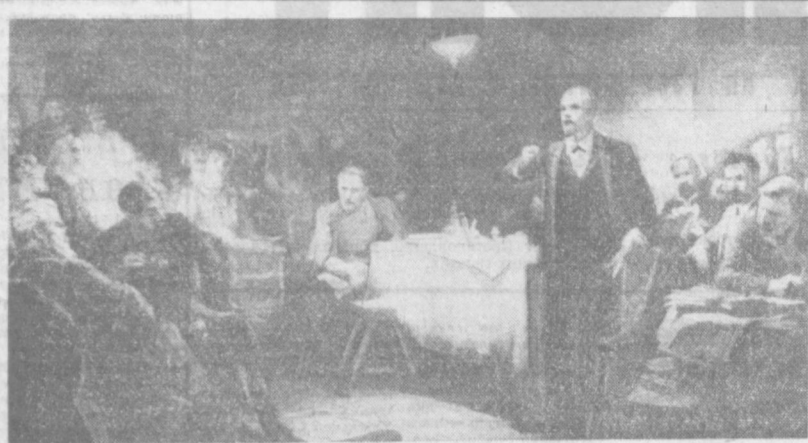
ВТОРОЙ СЪЕЗД РСДРП. КАРТИНА ХУДОЖНИКА Ю. ВИНГРАДОВА.