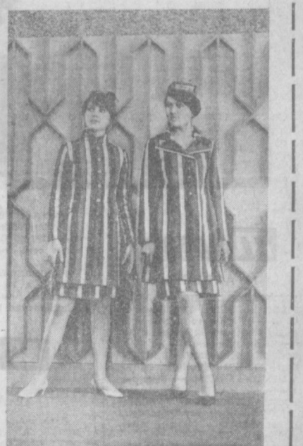
Новую коллекцию одежды подготовил к весенне-летнему сезону ташкентский Дом моды. Предложены платья из шерсти, сатина, льна, напрана и крепдешина, а также национальные платья. НА СНИМКАХ: (вверху слева) — весеннее платье из шерсти; (слева) — платье из напрана для девочек; (вверху справа) — национальная одежда из бекабаса.