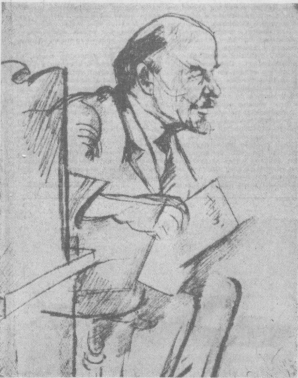
«Ленин» — рисунок с натуры, сделанный Н. Альтманом в мае 1920 года в кабинете В. И. Ленина.

— Ленинизм был и остается идейным знаменем и оружием Коммунистической партии Советского Союза, научной основой ее внутренней и внешней политики, — сказал секретарь горкома партии тов. В. В. Окунский в своем докладе коллективу Крупнопанельжилстроя. Наш социалистический общественный строй, правильная ленинская национальная политика обеспечили бурный подъем экономики и культуры Узбекистана. В стране, где царил патриархализм и неграмотность, сейчас осуществляется всеобщее обязательное бесплатное восьмилетнее обучение и начат переход к десятилетнему обязательному обучению. В 8100 школах Узбекистана обучается около 3 миллионов детей, работает свыше 125 тысяч учителей. В 275 школах нашего города учится более 220 тысяч ребят. В республике — 34 вуза, в том числе 2 университета. В высших учебных заведениях Узбекистана получают образование 224 тысячи студентов. Всеми своими успехами в экономическом и духовном развитии народа мы обязаны Коммунистической партии, созданной и вышедшей на мировой арене великим Лениным. Рабочие и работники Крупнопанельжилстроя дали слово трудиться еще лучше, досрочно завершить пятилетку.