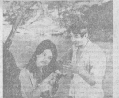
НА СНИМКАХ: кадры из фильмов «Ленин в Польше», «Журавушка», «Бал в субботу вечером», «Крест за отвагу».