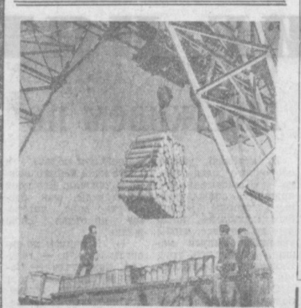
НАРЕЛЬСКИЙ АССР. В десятке адресов отправляет ежедневно древесину работникам нижнего склада Видлицкого лесопилки Олонского лесопроизводства. Древесина, заготовленная в лесах Приладожья, отличается высоким качеством. НА СНИМКЕ: погрузка экспортной древесины.