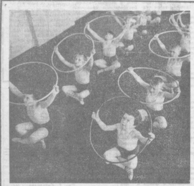
Любовь и спорту, в особенности к художественной гимнастике, прививает ребятам детского сада имени 50-летия Октября...