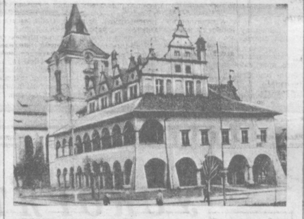
ЧЕХОСЛОВАКИЯ. НА СНИМКЕ: ратуша в стиле Ренессанса в Лявове (1615 г.).

Кубы капитана Антонио Нуньеса Хименеса. Как сообщили учредители общества, его задача будет заключаться в дальнейшем расширении дружественных связей между народами двух стран, а также в оказании трудящимся республики содействия в ознакомлении с достижениями Стран Советов в области экономики, науки, культуры.