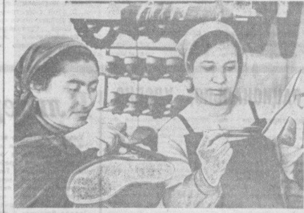
Много разнообразной модельной обуви выпускает и весенне-летнему сезону коллектив Ташкентской обувной фабрики № 2.