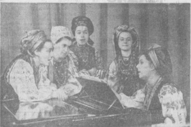
Квартет «Молодочки» — один из популярных коллективов художественной самодеятельности Киевского государственного университета имени Т. Г. Шевченко. В репертуаре квартета — украинские народные песни.