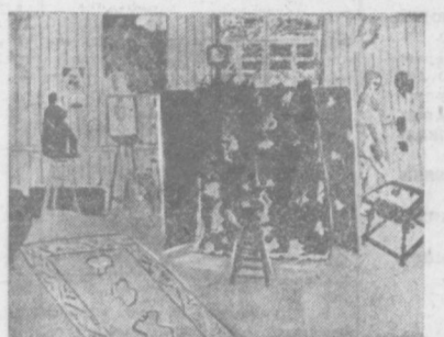
Рисунки Матисса обособились в особый мир. Естественный, лирический предвзятости взгляд художника на природу, энергичная интерпретация природы создает образ ясного и гармоничного мира. Тонкое сочетание тонов с удивительной силой передает иллюзию дрожащего от зноя света, атмосферу созерцательности и покоя.

Ленинграде и Музею изобразительных искусств в Москве. Среди них — живописные полотна, несколько скульптурных изображений, письма, книжные иллюстрации, рисунки, интереснейшие листы, выполненные в технике, называемой французскими «декупажем». Четыре картины предоставлены Национальным музеем современного искусства в Париже, а одна — семьей художника.