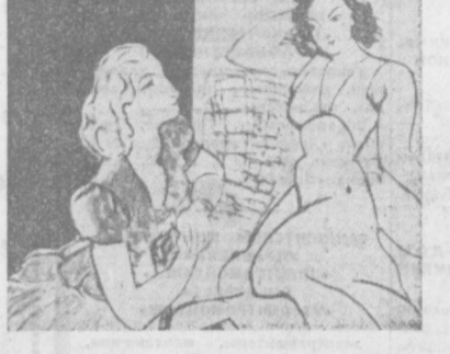
Чувственное отношение художника к предметному миру, переданное с восторгом и безграничным темпераментом, возбуждает не только эмоциональные, но и умственные переживания зрителя и его полотно.

В поисках повышенной декоративности Матисс обращается к пышной красочности восточного орнамента. «Статуэтка и ваза на восточном ковре», «Фрукты и бронза», «Красная комната» — чарующая серия картин, сотканная роскошью и причудами арабесок.