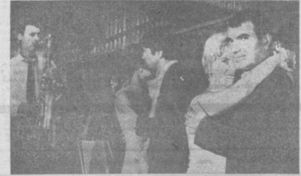
На снимках кадры из фильмов: «Сны Отечества», «Вдова и капитан», «Гибель Александра Великого».