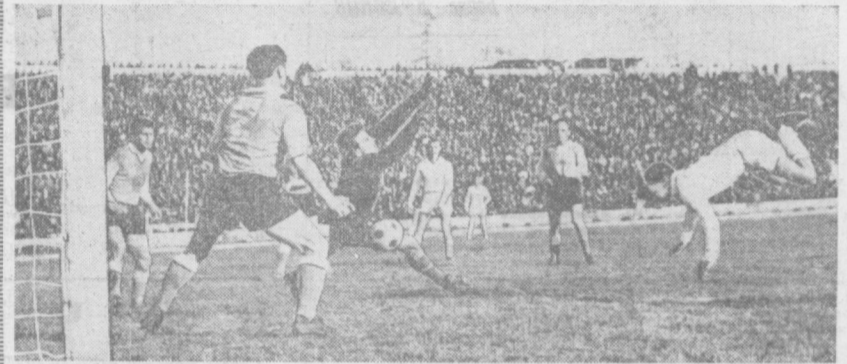
«АКРОБАТИЧЕСКИЙ ЭТЮД» НАПАДАЮЩЕГО.