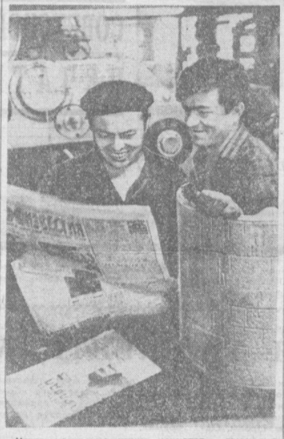
Через несколько минут начнется выпуск в свет очередного номера газеты.

покупают в ее фонд 22 рубля 78 человек (21 марта 1914 г.). Пожертвования продолжают и в 1917 году. Они идут не только из Ташкента, но из Самарканды, Конанды, Каттакурмана (от А. И. Рабова из лазарета — 7 р. 10 к.) и других городов Туркестана. «Правда» много и часто писала и пишет о строительстве социализма и коммунизма, об успехах в политической, экономической и культурной жизни Узбекистана. Когда-то «Правда» доставлялась в Ташкент поездом на седьмые сутки. Ныне десятки тысяч экземпляров газеты печатаются в Ташкенте, как и в некоторых других городах, ее читают ташкентцы в день выхода.