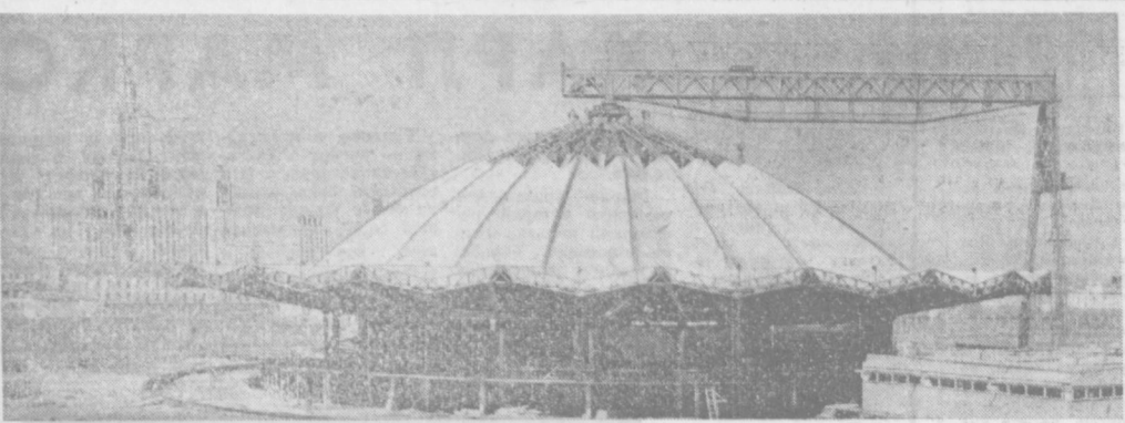
МОСКВА СЕГОДНЯ. На проспекте Вернадского близ станции метро «Университетская» строится здание Московского цирка на 3.200 мест. (Фотокорреспондент ТАСС).