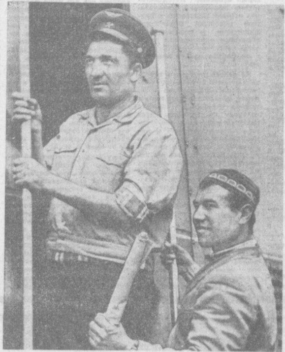
Каждый день со станции Салар Ташкентского отделения железной дороги отправляются поезда с грузами для народного хозяйства.

В торжественный день — День Победы дети преподнесли своим шефам-воинам большие букеты цветов.