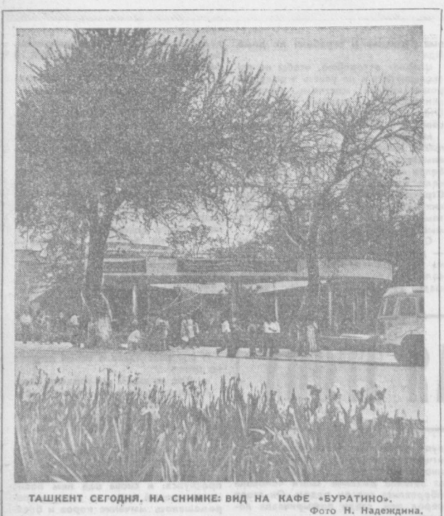
ТАШКЕНТ СЕГОДНЯ. НА СНИМКЕ: ВИД НА КАФЕ «БУРАТИНО».