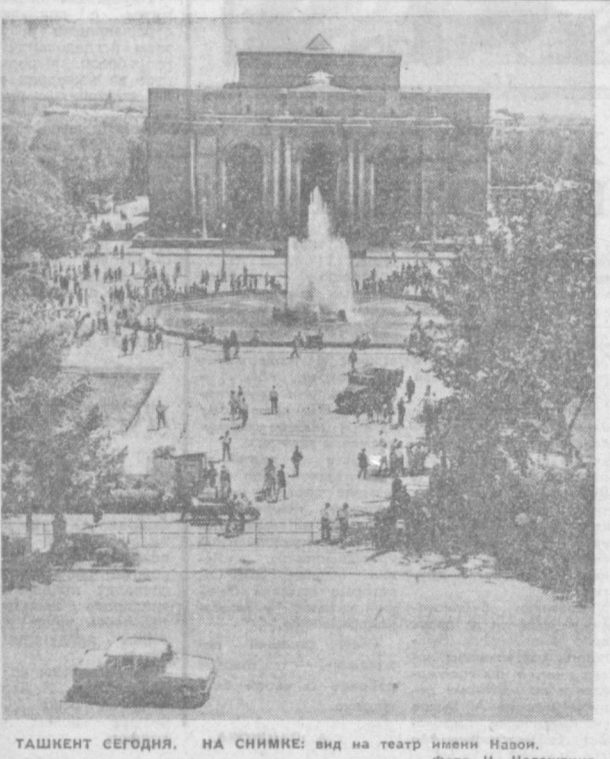
ТАШКЕНТ СЕГОДНЯ. НА СНИМКЕ: вид на театр имени Назоки.

Л. СУВОРОВ, профессор, доктор философских наук. (АПН).