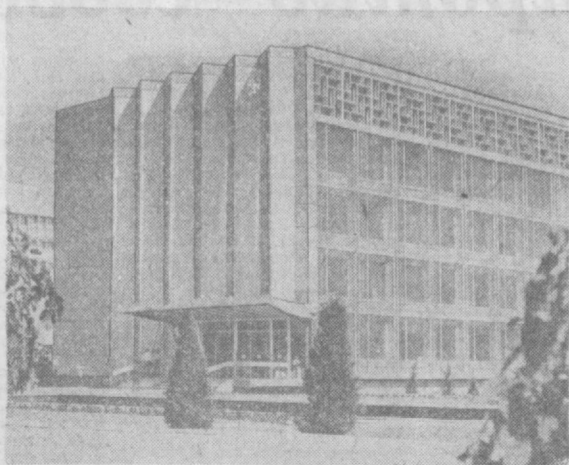
ТАШКЕНТ СЕГОДНЯ. Здание ЦК ЛКСМ Узбекистана.