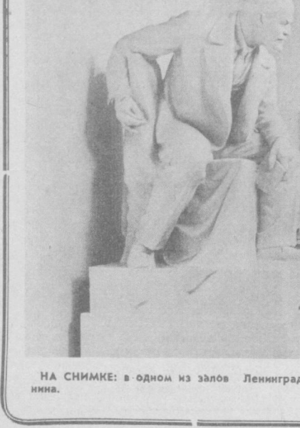
На снимке: в одном из запов Ленинградского филиала Центрального музея им. В. И. Ленина.