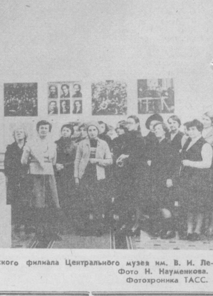
НА СНИМКЕ: в одном из запов Ленинградского филиала Центрального музея им. В. И. Ленина.