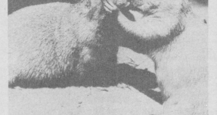
Нежное свидание забавных зверьков — так называют луговых собак — «подсмотрел» в Берлинском зоопарке фоторепортер агентства АДИ. Фотохроника ТАСС

Об этом сообщает газета «Джапан таймс». БЛУЖДАЮЩИЙ ОСТРОВ. На 115 метров за последние десять лет сместился необитаемый остров Киорук, расположенный у северо-западного побережья главного японского острова Хонсю. Об этом сообщает управление безопасности на море. Относительно быстрый дрейф Киорук специалисты объясняют тем, что он расположен на стыке крупных тектонических плит, которые оказывают мощное давление на остров.