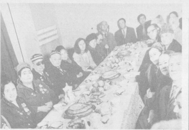
НА СНИМКЕ: участники концертно-фронтонных бригад.