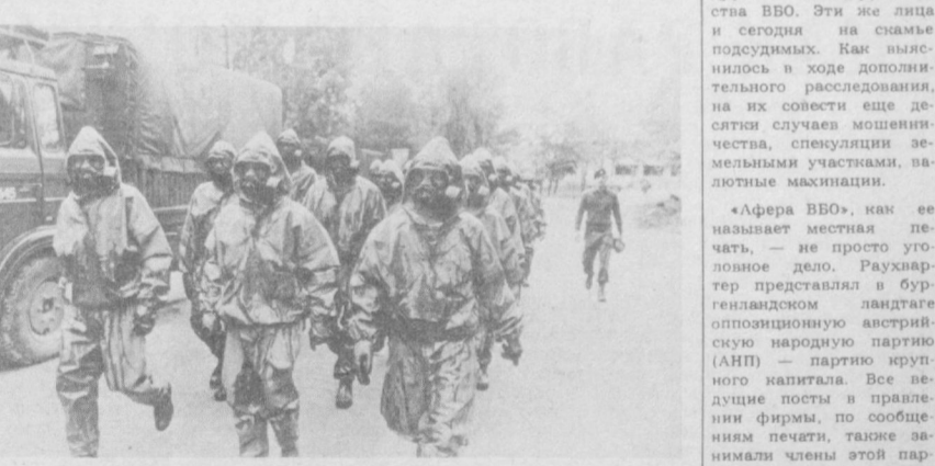
Норвегия. Под нажимом США и НАТО...

Из большой творческой поездки по Кашкарарьинской, Самаркандской, Ташкентской областям приехал известный деятель театра и кино народный артист СССР З. Мухамедов. Его творчество ценят и знают все любители искусства. В театре и кино он создал более 200 ролей. Это образ великого вождя пролетариата В. И. Ленина в спектакле, поставленном в Узбекском академическом театре драмы имени Хамзы, «Революционный этюд», «Шестое июля» М. Шатрова, «Заря революции», «Путеводная звезда» К. Йисена, из более 200 ролей. Это