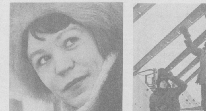
Узбекистан — Нечерноземью

Большую помощь труженникам сельского хозяйства Ивановской области в освоении земель оказывают специалисты нашей республики. Онио ств миллионы рублей капитальных вложений обязались освоить в одиннадцатой пятилетке здесь идет строительство объединенного предприятия стройиндустрии Главнечерноземстрой на водострой, которое будет производить 80 тысяч кубометров железобетонных деталей и конструкций в год для ирригационно-мелиоративного, производственного и жилищного строительства. В настоящее время производится выпуск железобетонных фундаментных блоков и дорожных плит. Расширяется фронт мелиоративных работ: уже построена широкая ирригационная сеть для полива овощей, культур и трав. В союзе Узбекистана завершено строительство школы на 320 мест, столовой, чай-