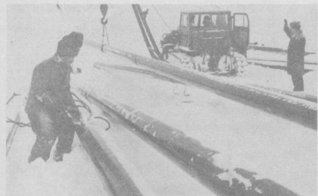
Узбекистан — Нечерноземью

Большую помощь труженникам сельского хозяйства Ивановской области в освоении земель оказывают специалисты нашей республики. Онио ств миллионы рублей капитальных вложений обязались освоить в одиннадцатой пятилетке здесь идет строительство объединенного предприятия стройиндустрии Главнечерноземстрой на водострой, которое будет производить 80 тысяч кубометров железобетонных деталей и конструкций в год для ирригационно-мелиоративного, производственного и жилищного строительства. В настоящее время производится выпуск железобетонных фундаментных блоков и дорожных плит. Расширяется фронт мелиоративных работ: уже построена широкая ирригационная сеть для полива овощей, культур и трав. В союзе Узбекистана завершено строительство школы на 320 мест, столовой, чай-