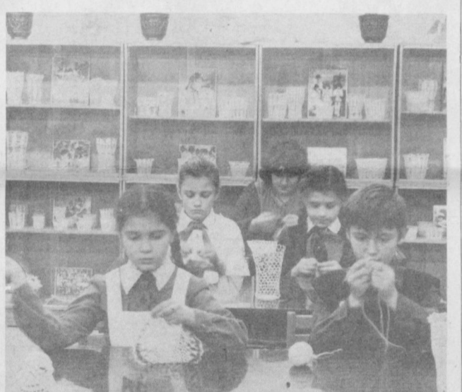
Кружковцы — непростые участники городских и республиканских конкурсов и выставок. Сейчас они