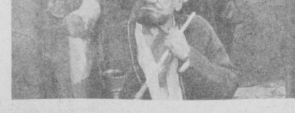
С. ДИВИНСКИЙ. НА СНИМКАХ: кадры из фильма.

Воспринимая на экране по архивным документам и историческим исследованиям хронику народного восстания, создатели филь-