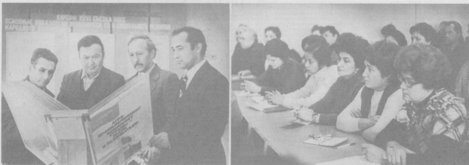
НА СНИМКАХ: во время перерыва слушатели школы идеологического актива знакомятся с информационными материалами на актуальную тему; идет занятие в школе идеологического актива.

В чем основные недостатки? У нас много членов общества, но мало высококвалифицированных лекторов. Мы видим необходимость в повышении идейно-теоретического уровня читаемых лекций, укреплении их связи с жизнью, с решаемыми задачами и взятыми обязательствами в трудовых коллективах.