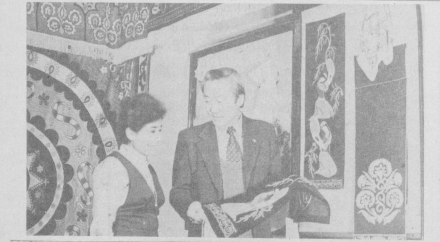
По законам братской гужбы помогают шефы