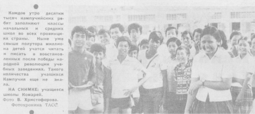
НА СНИМКЕ: учащиеся школы Крамарей.

Во время грозового ливня Иван да Аня случайно оказались под одной крышей с Джимом и Сэлли. Потолоквали о том, о сем. Когда дождь кончился и новые знакомые разошлись, Аня воскликнула, имея в виду американку: «Как она мила! Между прочим, тоже преодолела музыку». А Джим пересказал Сэлли рассуждения Ивана насчет того, что ему нравится в начальниках, а что — нет.