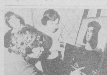
В ноябре 1983 года из будапештского Музея изящных искусств были похищены семь наиболее ценных картин известных мастеров. В их числе — произведения Рафаэля Санти «Мадона Эстерхази» и «Портрет юности», а также картины Пальмы Венкио, Дж. Б. Тьеполо и Я. Тинторетто.

ПЧЕЛЫ — УБИЙЦЫ. На север карибского острова Тринидад и Тобаго вторглись полчища африканских пчел, привезенные в уклад все окрестные населенные пункты. Первыми их жертвами стали три человека, один из которых умер от укусов, два других находятся в больнице в тяжелом состоянии. Многочисленные лужки для агрессивных пчел оказались неэффективными.