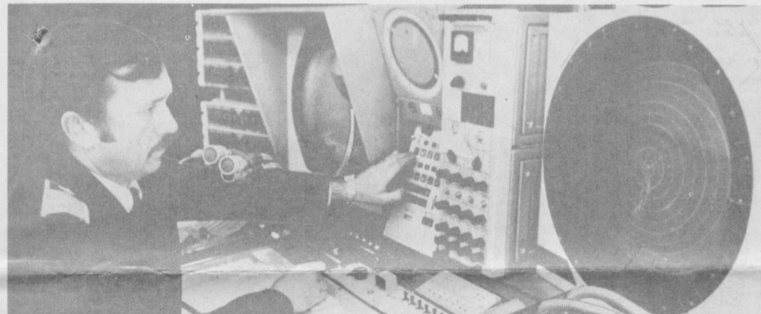
Завтра — День Аэрофлота