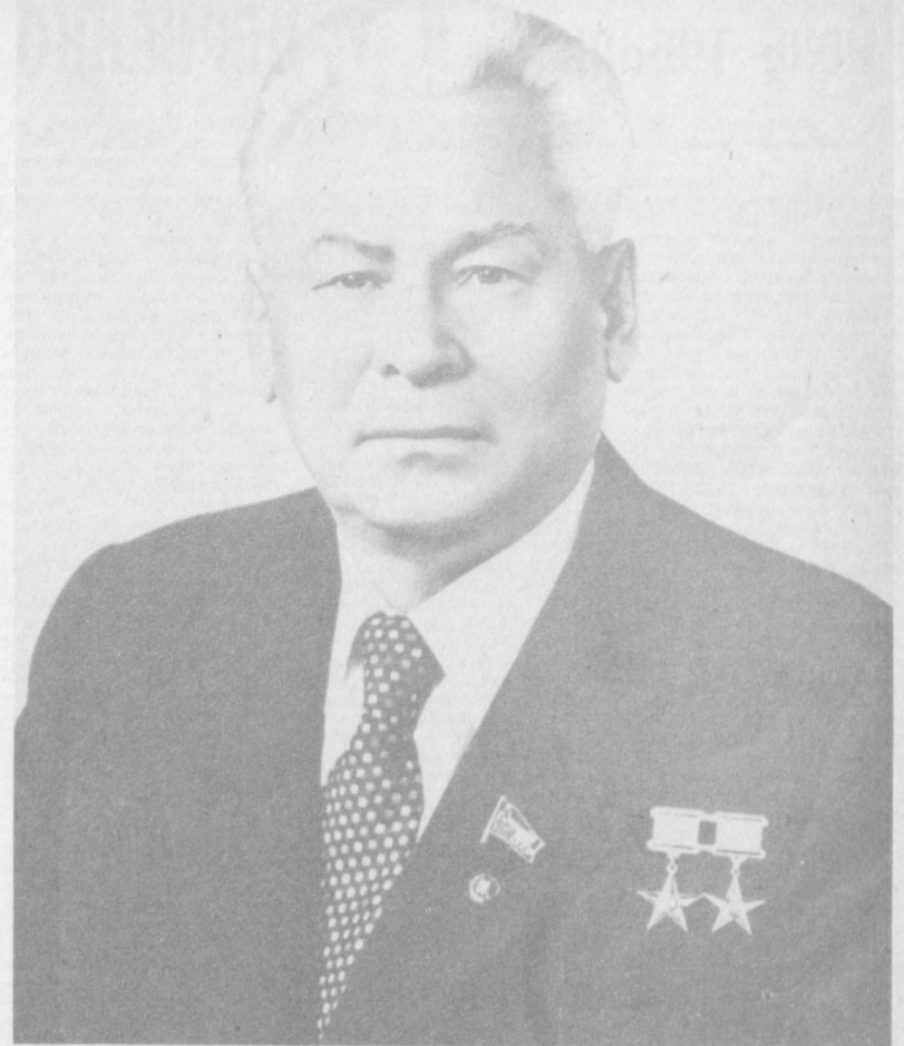
Константин Устинович ЧЕРНЕНКО

Генеральным секретарем ЦК КПСС единогласно избран Константин Устинович ЧЕРНЕНКО.