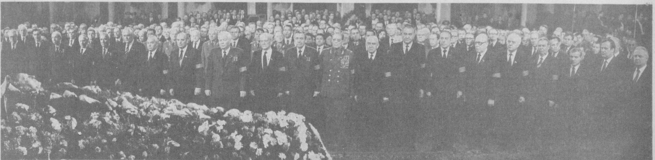
Участники Пленума ЦК КПСС прощаются с Ю. В. Андроповым.