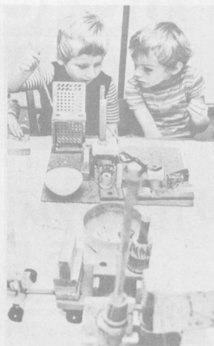
ЧССР. Эти мальчики — воспитанники пражского детского сада. В связи с новой программой дошкольного воспитания малыши уже в пять-шесть лет познают основы техники.

алистического развития, в том числе Афганистану, Анголе, Эфиопии, Народной Демократической Республике Йемен, Мозамбику и Никарагуа. Тем самым, указывает «Хоризонт», ГДР содействует упрочению их экономической самостоятельности, политическому и социально-экономическому развитию. С 1951 года в ГДР получили образование примерно 20 тыс. граждан 120 стран мира.