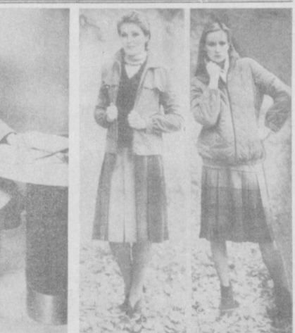
НА СНИМКАХ: деловой комплект для работы. Жакет с отстрочкой по полочке и низу. Элегантность такому наряду придает блузка с завязывающимся бантом; теплый уличный комплект: под жакетом вязаный джемпер, юбка в складку; с теплой просторной курткой хорошо смотрится клетчатая юбка с грушовой складкой.

Свободно комплектуемая одежда, состоящая из отдельных вещей, привлекает многих женщин. И решая, что шить и теплым дням, многие выбирают комплекты, в которых один и тот же жакет можно носить с различными юбками, брюками. Конечно, такое объединение отдельных вещей требует вкуса и фантазии, но учитывая, что прежние наборы, запрещающие сочетания в одном ком- плекте разных материалов, теперь забыты, выбор стал шире. Вязаный шерстяной жакет и жакет ныне носят поверх нежной блузки — по прежнему понятиям, и такой блузке полагались бы праздничные жакеты, юбка. Освежить, обновить внешний вид помогают дополнения — спортивные, деловые и романтические. Популярны шарфы и шейные платки, завязанные бантом.