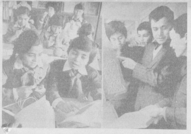
Во дворцах и домах пионеров города большое внимание уделяется развитию у детей интереса к различным специальностям, прививаются начальные навыки. НА СНИМКАХ (слева направо): интересно проходит занятия в кружке вязания Дюра пионеров имени Ахунбаева; в кружках резьбы по камню Дюра пионеров имени Остурова дети постигают азы этого древнего вида искусства.