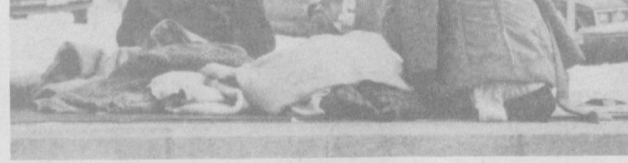
Негритянское население США все глубже погружается в нищину. Голод, массовая безработица, поспешные элементарные гражданские права — все это стало повседневной действительностью для миллионов чернокожих американцев. Так, согласно явно заниженным официальным данным на ноябрь 1983 года, 17,3 процента из них лишены права на труд. Причем этот показатель не учитывает миллионы частично безработных. Еще острее, чем раньше, среди негритянского населения США стоит проблема нищеты. НА СНИМКЕ: бездомные темнокожие жители Вашингтона.

Вербелен — отнюдь не единственный нацистский преступник, активно использующийся американскими спецслужбами в антимономистических и антисоветских целях. Помимо него, и это подтвердили выводы официального расследования министерства юстиции США, они пригласили под своим крылом бывшего шефа гестапо Лиона Барбье, на совести которого тысячи замученных французских борцов Сопротивления. Хорошо известно, что и по сей день в США преспокойно проживают сотни бывших нацистов, аслуживших «прошпешен» американского правительства за верную службу Вашингтону.