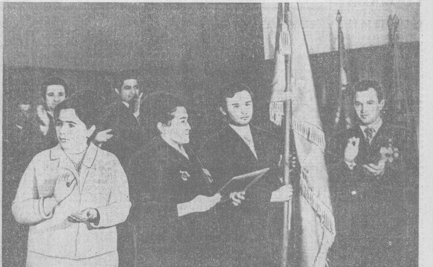
ТАШКЕНТ. 4 апреля 1975 года. Зал заседаний Ташкентского обкома партии. Вручение представителям города переходящего Красного знамени ЦК КП Узбекистана, Совета Министров Узбекской ССР, Узсовпрофа и ЦК ЛКСМ Узбекистана.

ВЧЕРА в зале заседаний Ташкентского обкома партии состоялось собрание актива партийных, советских, профсоюзных и комсомольских организаций столицы совместно с представителями коллективов трудящихся, посвященное вручению г. Ташкенту переходящего Красного знамени ЦК КП Узбекистана, Совета Министров республики, Узсовпрофа и ЦК ЛКСМ Узбекистана. Эта награда присуждена за достижение наилучших результатов в республиканском социалистическом соревновании за досрочное выполнение народнохозяйственного плана 1974 года.