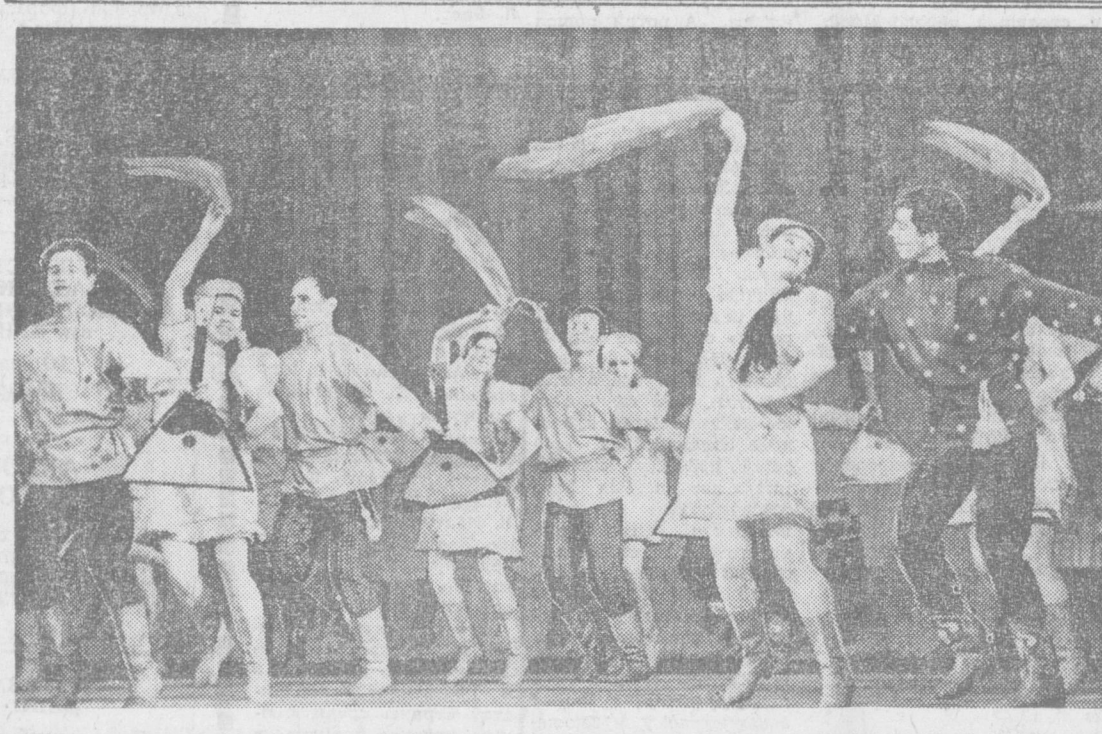
НА СНИМКАХ: слева — выступает народный ансамбль танца Белорусского государственного университета; сверху — идет заетия в консерватории (инструментальное трио).

русские, изобразительная поэма героико-трагического плана. Во всем этом есть закономерности. Названные картины рассказывают о том, что больше всего волновало художника, когда он после окончания войны вернулся к родным местам. Но этому предшествовала полная драматизма история. О ней я услышал тогда же, на московской выставке. родные места влекли его, и он вернулся в Белоруссию. — Помню живое ощущение людскими всех событий партизанской войны, — вспоминает художник. — Она вошла в их судьбу как глубоко личное, прочувствованное. Да, давняя мечта с победой вернуться в родные места осуществилась, но Белоруссию он не узнал. Вся земля