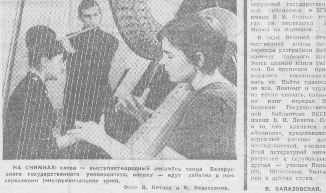
НА СНИМКАХ: слева — выступает народный ансамбль танца Белорусского государственного университета; сверху — идет заетия в консерватории (инструментальное трио).