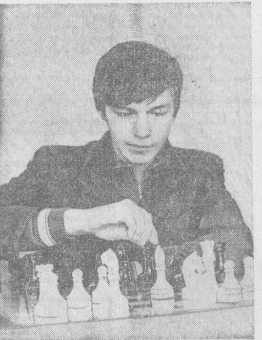
И. АЛИМОВ.

— Кто является вашим шахматным кумиром? — Очень нравится игра Карпова, Корчного и Юбнера.