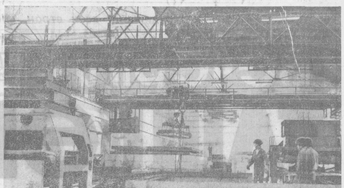
Производство бетонных блоков для строительства БМ освоил Сергеевский завод железобетонных конструкций. Сотни их предприятие уже отравило для сооружения мостов при прокладке магистрали. НА СНИМКЕ: в цехе железобетонных изделий завода.