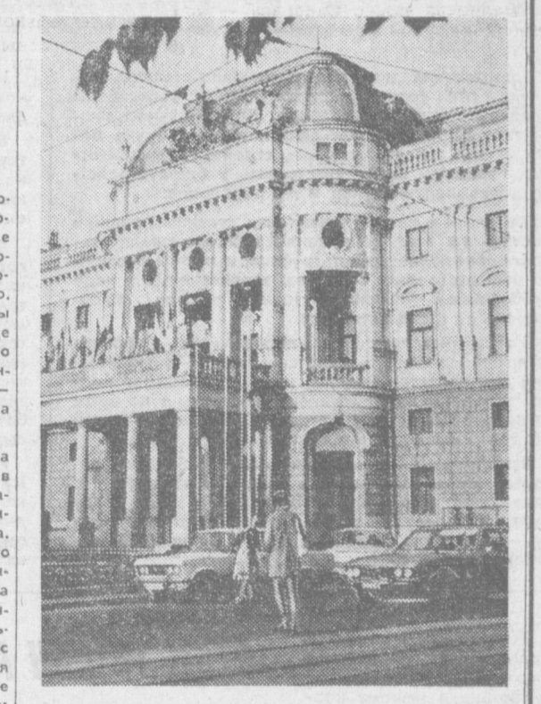
ПО ГОРОДАМ МИРА. БРАТИСЛАВА. Здание народного театра.