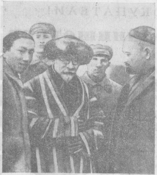
НА СНИМКЕ: один из первых кадров узбекской кинохроники — приезд М. И. Калинин в Узбекистан.