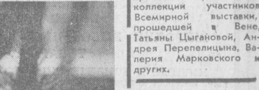
Наедине с книгой.