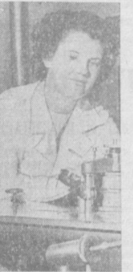
Эти снимки сделаны в геотехнической лаборатории института «Узгипрозем». Здесь исследуют грунт под строительство зданий и сооружений в сельских местностях.

финишу, который приурочивается к районным, городским и областным партийным конференциям. Эстафетные команды областей по дню открытия XVIII съезда Компартии Узбекистана доставят в Ташкент сводные рапорты коллективов трудящихся. Затем рапорт республикан будет отправлен в Москву XXIV съезду КПСС. (УзТАГ).