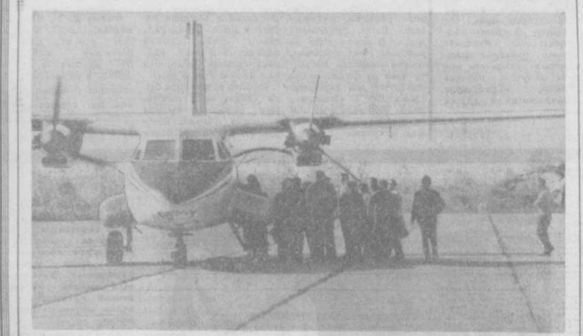
В Чехословакии создан новый тип турбовинтового самолета «Л-410» с вертикальным взлетом и посадкой...

В странах социализма К космическому телевидению СОФИЯ. Пятая пятилетка принесла новые большие успехи болгарского телевидения.