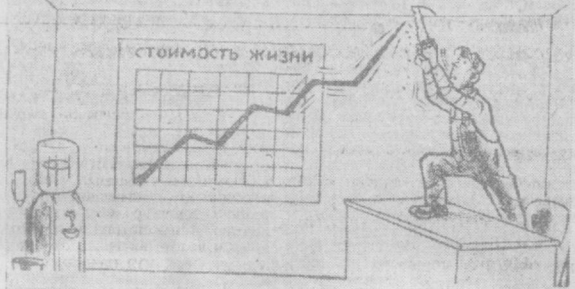
Подготовка и очередному повышению цен. Рисунок из американской газеты «Дейли уорлд».