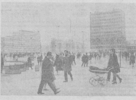
Еще красивей и просторнее стала после реконструкции центральная площадь столицы ГДР. За последние годы здесь выросли новые многоэтажные здания. Александерплац стала символом строительства нового демократического Берлина.