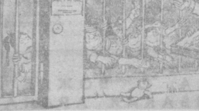
— Гашинца у меня сегодня больше нет, а вот ЛСД, героин и марихуана еще имеются... Карикатура из журнала «Кино» (ФРГ).

В ФРГ резко увеличилось потребление наркотиков. По заявлениям официальных лиц, наркомания подержана всем слоем населения. Особую опасность представляет ее распространение среди молодежи. (Из газет).