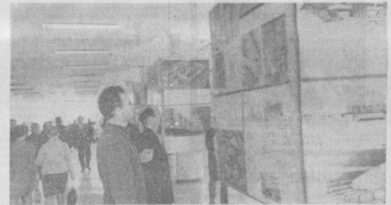
В перерыве делегаты знакомятся со стендами выставки «Ташкент сегодня и завтра».

ЭТОМУ вопросу уделено большое внимание многие делегаты конференции.