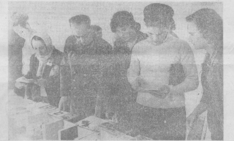
С большим интересом участники конференции знакомились с новейшей общественно-политической литературой.

Особую ответственность мы должны нести за то, что ведущая строительная организация города — Главташкентстрой — за пятилетку план по вводу жилья выполнила только на 73 процента, школ — на 69 процентов, детских дошкольных учреждений — на 47 процентов, объектов здравоохранения — на 82 процента. Организациями Главташкентстрой за этот период недостроено 84 миллиона рублей. Серьезную озабоченность должны вызывать и то обстоятельство, что производительность труда в сравнении с 1965 годом выросла только на 9 процентов и в то же время рост средней заработной платы составил 33 процента. Нельзя так руководить строительным производством, потому что при такой постановке дела мы больше проедаем, чем создаем! И это идет в разрез с