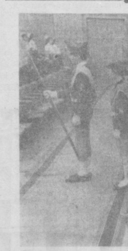
Приветствовать делегатов городской партийной конференции пришли учащиеся и воспитанники детских садов города.

НЕПРЕЛОЖНЫМ ЗАКОНОМ для промышленности предприятий является государственный план. Его выполнение — первичный долг коллективов и их руководителей перед государством. Но, и создавая, далеко не все из них усвоили эту истину. Иначе чем объяснить то, что около 30 промышленных предприятий города ежегодно срывают выполнение планов. Им недодало народному хозяйству за пятилетку продукции более чем на 90 миллионов рублей. Среди них есть даже такие крупные предприятия, как текстильный и машиностроительный, завод «Подземник», кроватный, кафеля фабрика и другие. У нас еще немало заводов