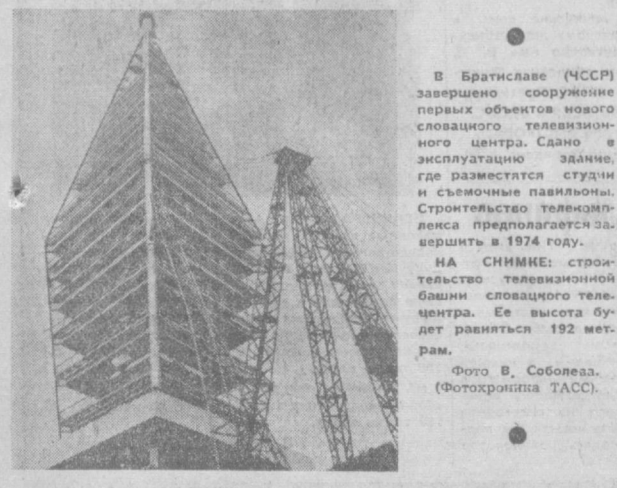
В Братиславе (ЧССР) завершено сооружение первых объектов нового словачского телевизионного центра. Садно в эксплуатацию здание, где размещаются студии и съемочные павильоны. Строительство телекомплекса предполагается завершить в 1974 году.

Государственный Знак качества присвоен таким восьми моделям женских платьев ташкентской швейной фабрики «Красная заря» и трем моделям мужских сорочек Конавской швейной фабрики имени Абуабалева. В 1971 году экспонат Государственной выставки «Космос» намерено представить лучшие образцы продукции Чирчикской обувной фабрики, женских белье Ташкентской трикотажной фабрики и детской пальто швейной фабрики «Красная заря».