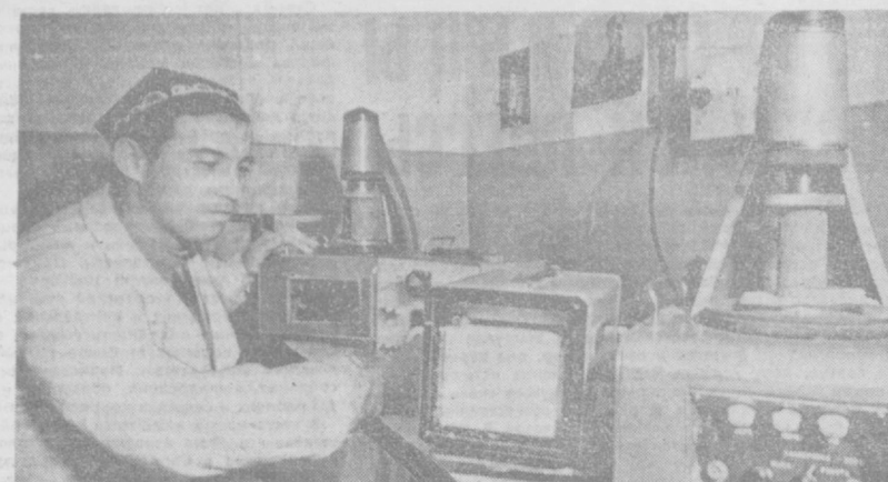
В горных и предгорных районах Средней Азии развиты оползневые, селевые, геодинамические и другие явления...