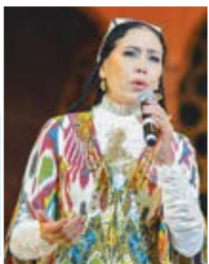
Munajjat YO'LCHIYEVA, O'zbekiston xalq artisti, senator, O'zbekiston Qahramoni

fransuz tilini o'rganmoqda. Tahlillarga ko'ra, mamlakatimizdagi 700 ga yaqin maktab va 13 ta universitetda fransuz filologiyasi bo'yicha ta'lim beriladi.