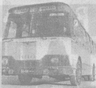
В 1971 году на Курганском автобусном заводе начнется серийный выпуск новой машины «Кавз-685». Этот автобус предназначен для эксплуатации в сельской местности, а также в условиях Севера. Конструкторы разработали новый автобус для города. Его марка — «Кавз-3100», скорость — свыше 90 километров в час, вместимость салона — 90 человек. НА СНИМКЕ: новый автобус городского типа «Кавз-3100» «Сибирь».