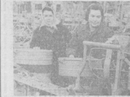
С каждым днем все шире развертывается социалистическое соревнование среди коллективов машиностроителей завода «Узбексельмаш» по достижению цели XXIV съезда КПСС. Ежедневно предприятие отправляет сельским труженикам страны сотни различных сельхозмашин.