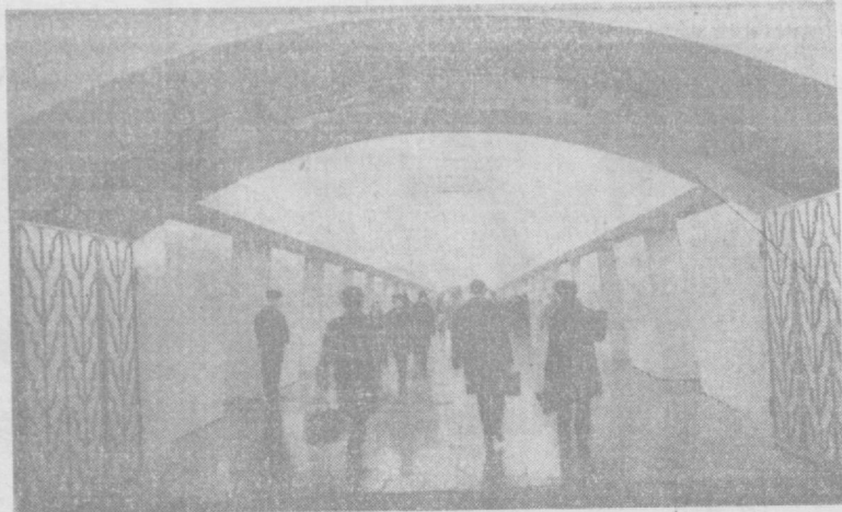
МОСКВА. В канун Нового года московские метропостройки сдали в эксплуатацию два новых участка Калужско-Рижского и Ждановско-Краснопресненского диаметров метрополитена от станций «Новокузнецкая» и «Таганская» до станций «Площадь Ногина». В начале января по линиям этих участков пошли первые поезда. Теперь общая протяженность подземной транспортной магистрали города достигает почти 140 километров, а количество станций увеличилось до 89.

З. МЕДВЕДЕВА, госавтоинспектор ГАИ МВД УзССР.