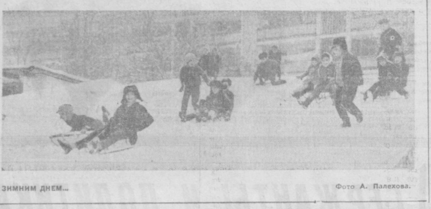
Зимним днем...