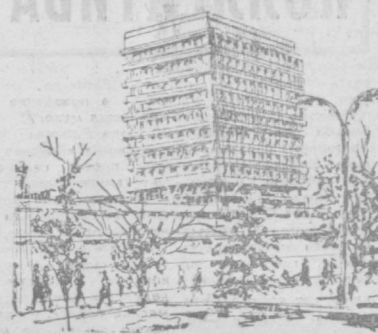
Зима в Ташкенте.